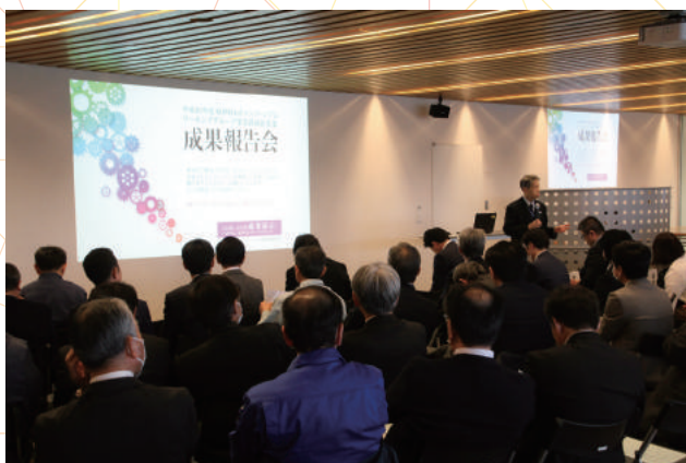
ワーキンググループ事業費補助事業「成果報告会」 (2019年2月8日)