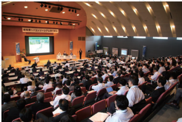
設立総会（平成30年6月15日）