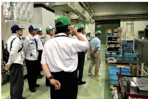
工場見学（株式会社イマオコーポレーション）